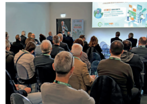
Un momento di incontro con i clienti

Rispetto dei tempi, gentilezza operativa e pragmatismo sono termini che racchiudono l'essenza di Agomir. "Siamo produttori di software, il costo della ricerca e sviluppo non è banale ma è una forma d'arte che difendiamo. Proseguire con questa nostra anima significa investire in progetti di questa natura. È la nostra cifra distintiva, sin dal primo giorno in cui mio padre negli anni Ottanta ha fondato l'azienda. L'hardware e i sistemi sono stata la prosecuzione naturale per poter rispondere alle esigenze dei clienti in una logica di servizio completo".